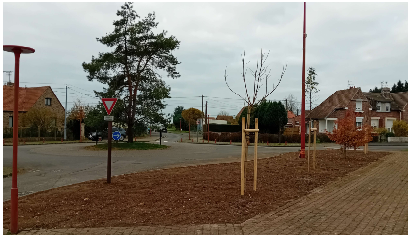
La commission « Cadre de vie et développement durable »

Merci à l'entreprise émerchicourtoise A.L. CONCEPT qui a réalisé cet espace paysager.