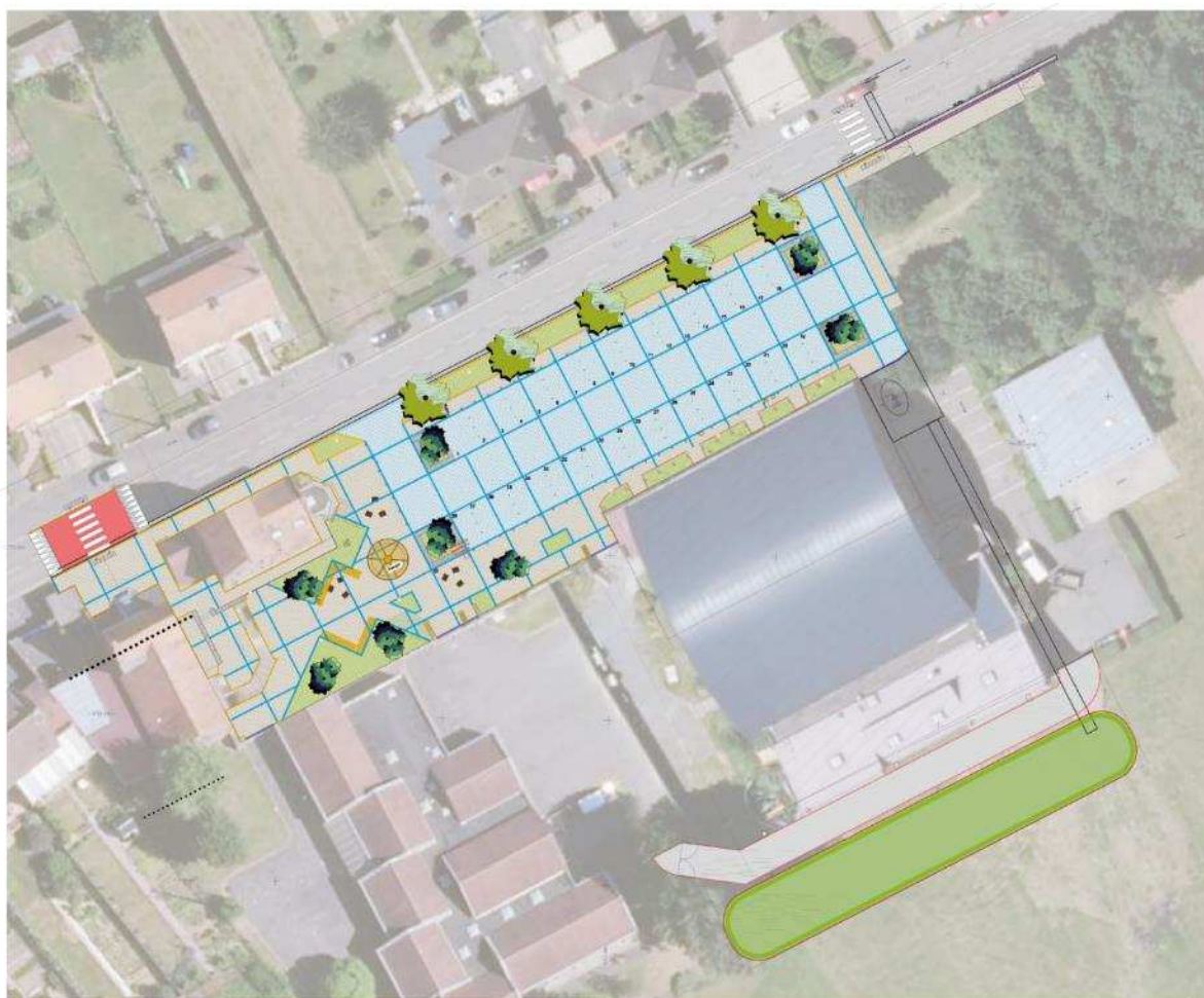
REQUALIFICATION DE LA PLACE DU CENTRE BOURG ET DE LA RD 205