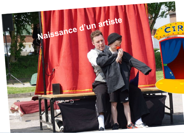
Naissance d'un artiste