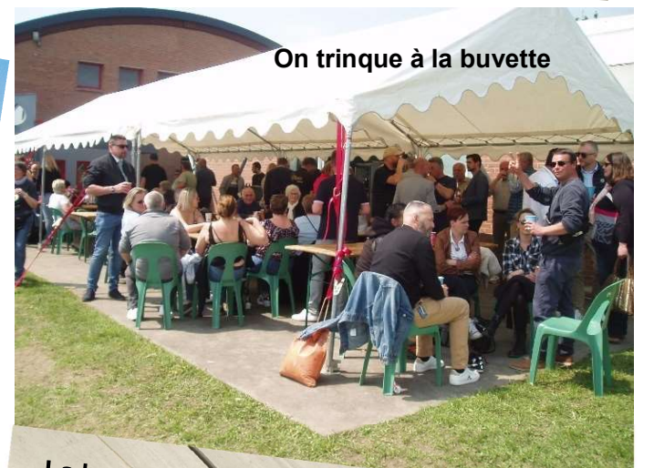
On trinque à la buvette