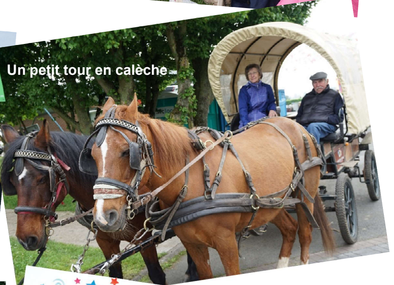
Un petit tour en calèche