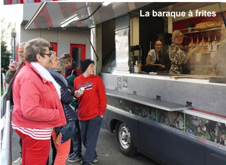
La baraque à frites