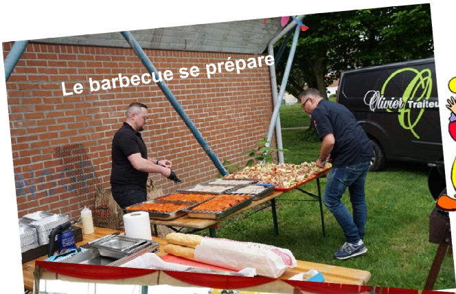
Le barbecue se prépare