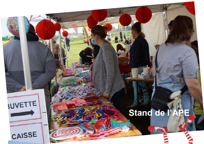
Stand de l'APE