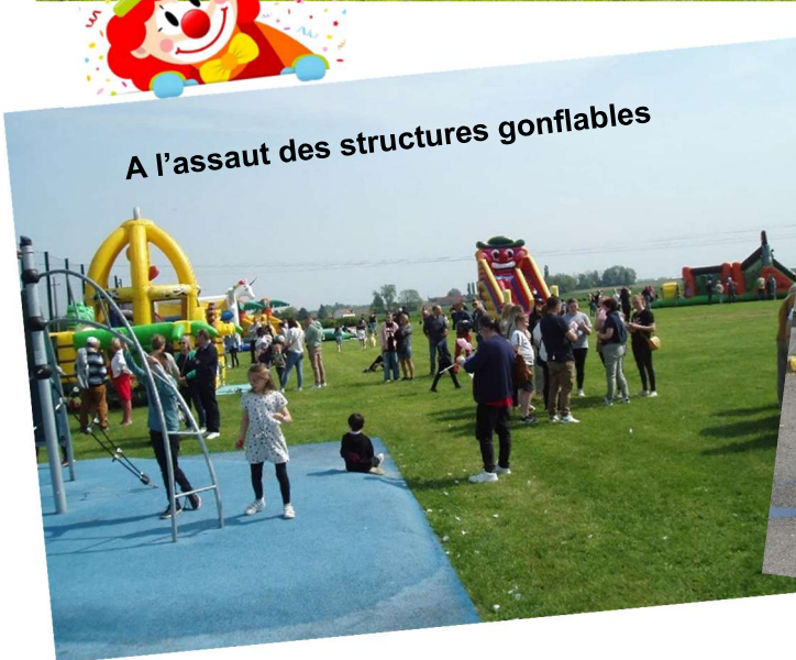
A l'assaut des structures gonflables