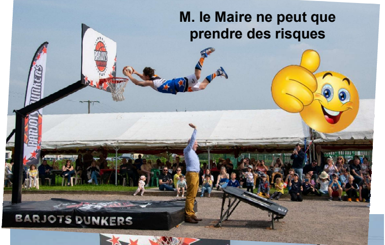
M. le Maire ne peut que prendre des risques