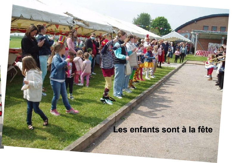
Les enfants sont à la fête