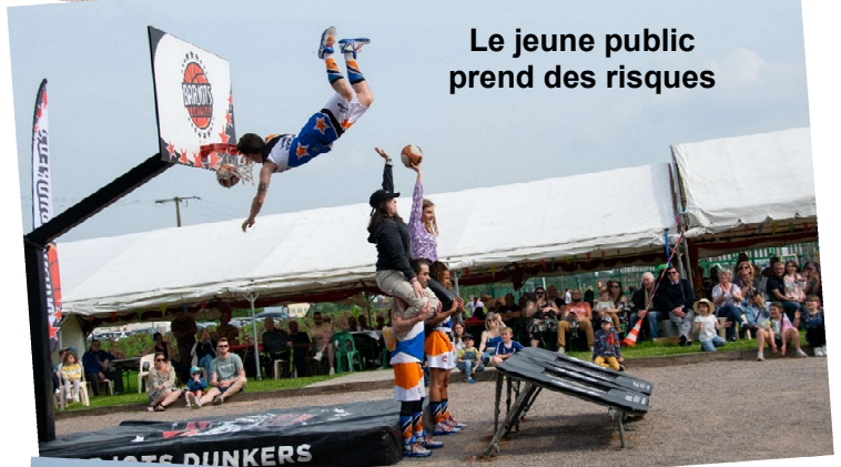
Le jeune public prend des risques