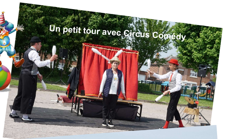
Un petit tour avec Circus Comédy