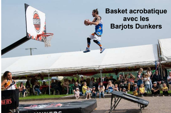
Basket acrobatique avec les Barjots Dunkers