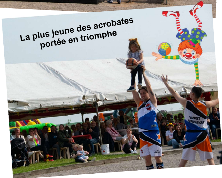
La plus jeune des acrobates portée en triomphe