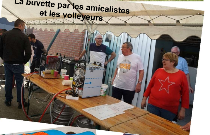
La buvette par les amicalistes et les volleyeurs