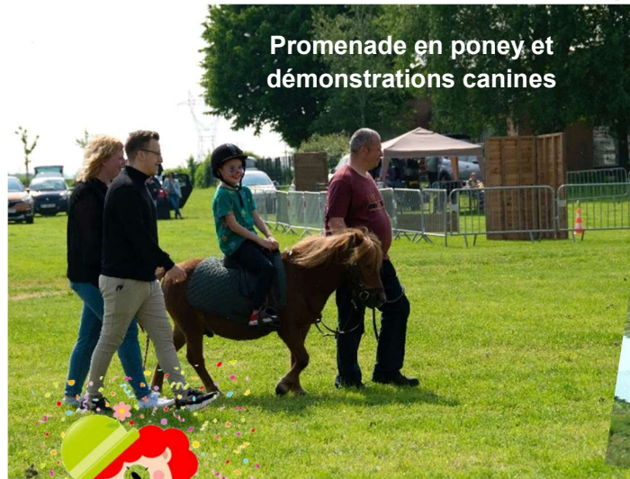
Promenade en poney et démonstrations canines