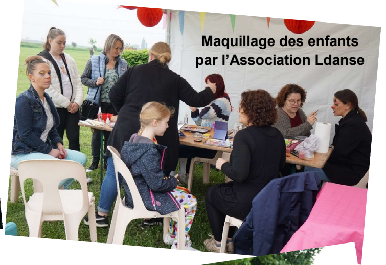
Maquillage des enfants par l'Association Ldanse