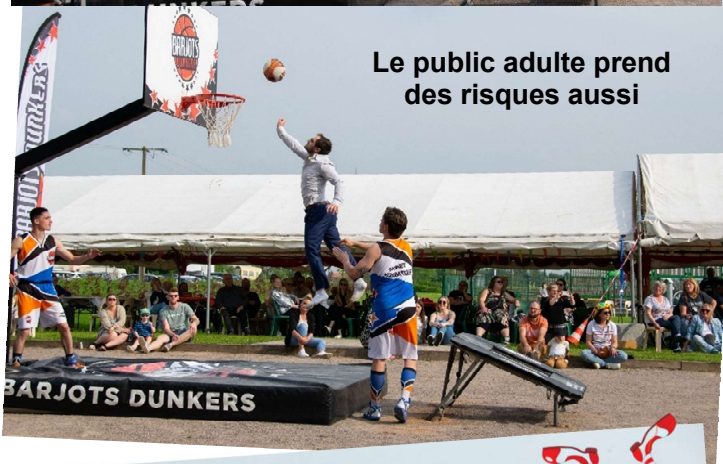
Le public adulte prend des risques aussi